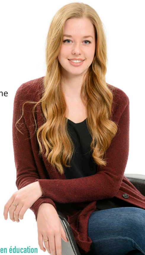
Étudiante au Bac en éducation