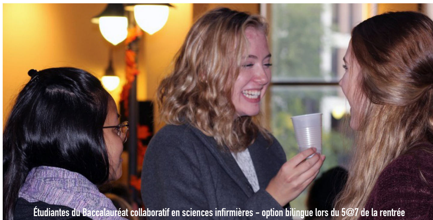
Étudiantes du Baccalauréat collaboratif en sciences infirmières - option bilingue lors du 5@7 de la rentrée