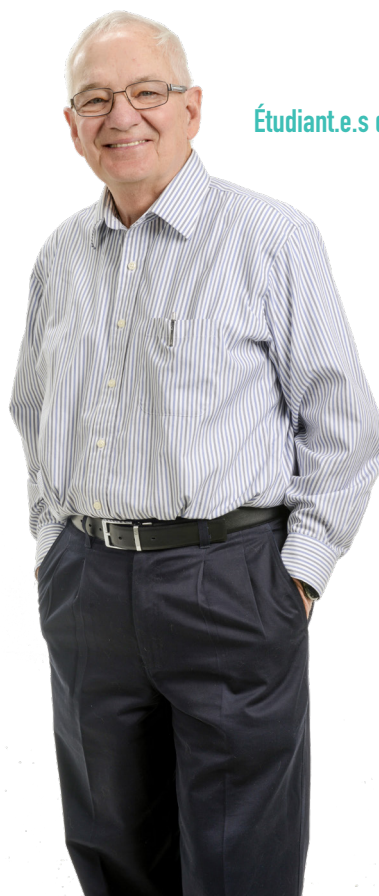
Étudiant.e.s du Centre de formation continue